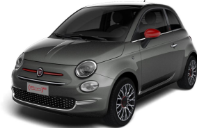
695 (5DP) Siva Pompei (metalik)