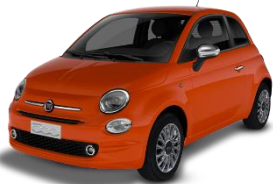
562 (5CK) Narančasta Sicilia (pastelna)