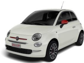
268 (5CA) Bijela Gelato (pastelna)