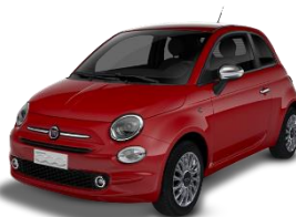
111 (5CJ) Crvena Passione (pastelna)