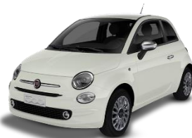
268 (5CA) Bijela Gelato (pastelna)