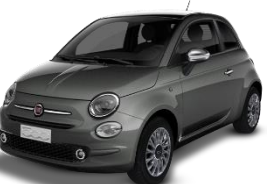
695 (5DP) Siva Pompei (metalik)