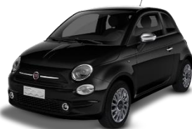
876 (5CE) Crna Vesuvio (metalik)