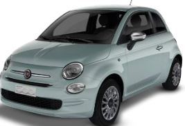
196 (5CD) Zelena Rugiada (mikalizirana)