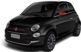
876 (5CE) Crna Vesuvio (metalik)

■ standardna oprema; O opcija naručivanje; - nije moguće; Opcija 'u paketu' je dio jednog od paketa. Cijene su u KM, u cijenu je uključen PDV.