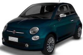
687 (5DT) Plava Dipinto di blu (metalik)