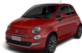
111 (5CJ) Crvena Passione (pastelna)